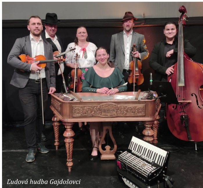
Ľudová hudba Gajdošovci