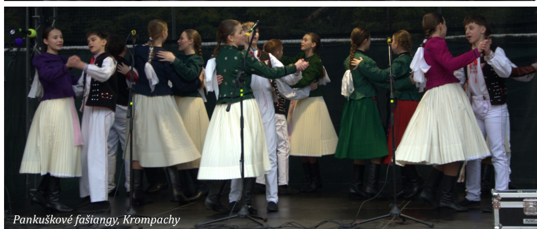
Pankuškové fašiangy, Krompachy