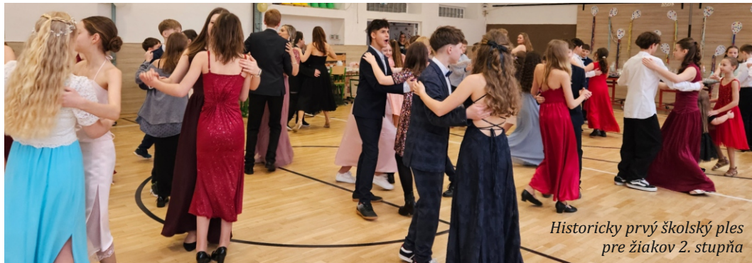
Historicky prvý školský ples pre žiakov 2. stupňa

Fašiangové oslavy vyvrcholili o týždeň neskôr, keď sa