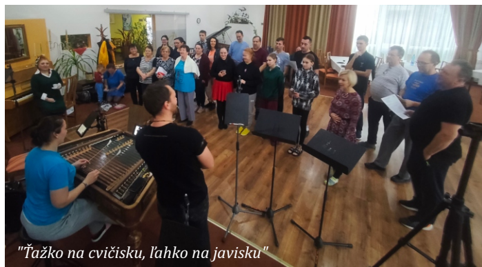
"Ťažko na cvičisku, ľahko na javisku"