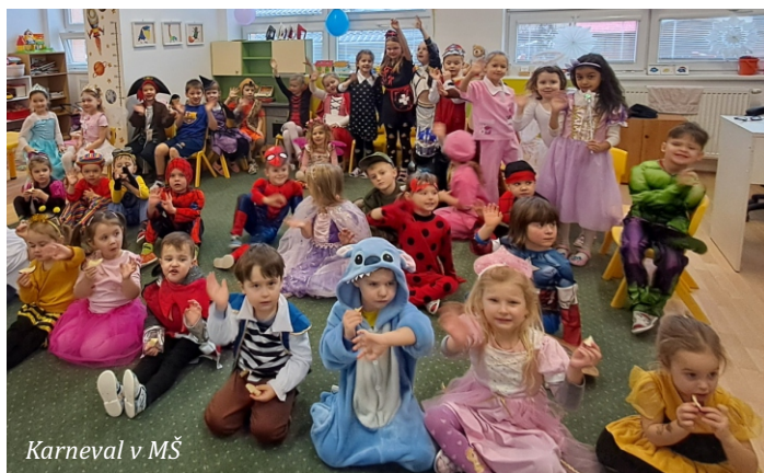
Karneval v MŠ