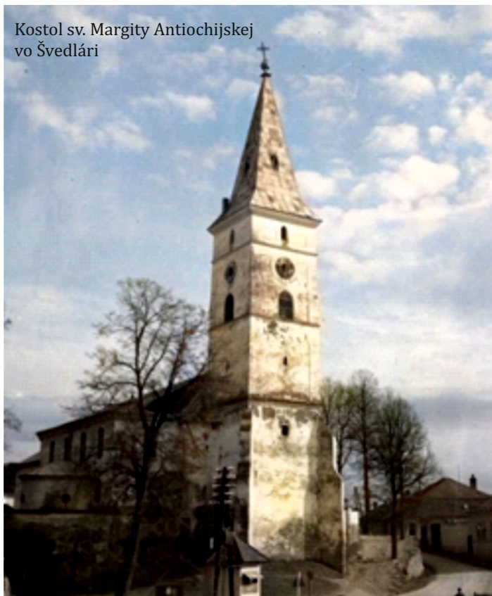
Kostol sv. Margity Antiochijskej vo Švedlári