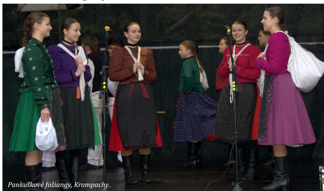
Pankuškové fašiangy, Krompachy