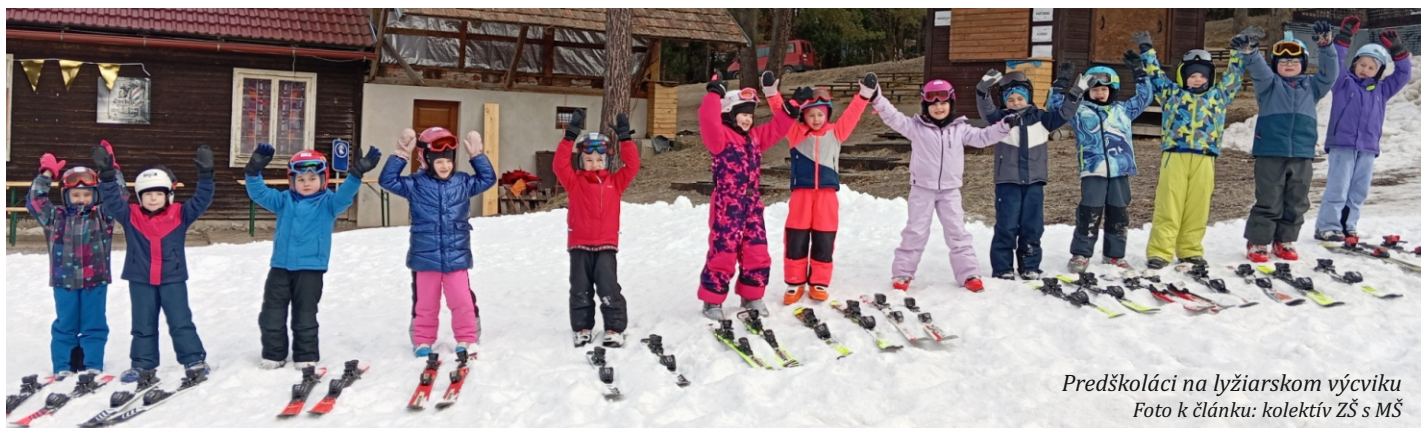
Predškolačky na lyžiarskom výcviku